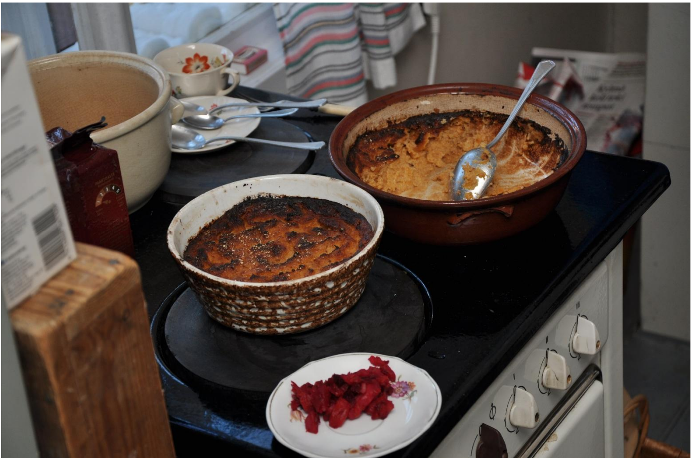
Korsmanin talon joulutunnelmia