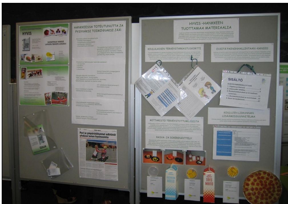
Kuva 3. Hankkeen esittely kouluterveyspäivillä 2009

Hanketta on käyty esittelemässä myös hankekuntien ulkopuolella. Valtakunnallisessa Terve Kunta -verkostossa, kouluterveyspäivillä (Kuva 3.), Satakunnan sairaanhoitopiirin alueellisessa lasten lihavuus koulutuksessa sekä Länsi-Suomen lääninhallituksen koulutuksessa kuntapäätäjille on käyty kertomassa hankkeen tavoitteista, toteutuksesta ja luodusta toimintamallista. Hanke on herättänyt runsaasti kiinnostusta.