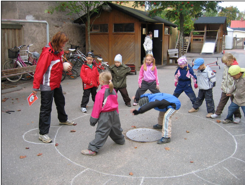
Kuva 2. Pihapelikortit käytössä Riihikadun päiväkodissa

Koulujen liikunnan lisäämissuunnitelman jokainen alakoulu täyttää vuosittain koulukohtaisesti ja pohtii miten omalla koululla voitaisiin lisätä koululaisten liikunnasta. Suunnitelmassa huomioidaan koulumatkat, välitunnit, liikuntatunnit, koulu-kerhot ja kilpailutoiminta. Opettajilla on käytössään liikunnasta ja ravitsemuksesta materiaalipaketti vanhempainiltoja ja – vartteja varten.