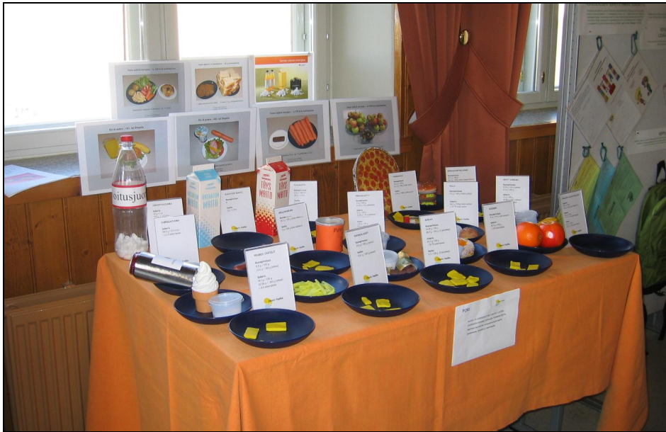
Kuva 1. Rasva- ja sokerinäyttely

Hankkeen aikana Porin suun terveydenhuolto on järjestänyt näkyvän kampanjan linja-autojen kylkitarroilla, teemana riittävä hampaiden harjaus. Lisäksi yläkouluilla kiersi musikaali kertomassa hampaiden hoidosta ja puhtaan suun merkityksestä. Hammasseikkailu -nukketeatteriesitys on kiertänyt hankekuntien päiväkodeissa kertomassa hampaiden hoidosta ja harjauksesta. Nukketeatteriesitys on saamassa jatkoa: suun terveydenhuoltoon on tilattu nukketeatterinuket ja henkilökuntaa koulutetaan esittämään. Porin suun terveydenhuollon oma raportti hankkeeseen osallistumisesta on esitetty tämän raportin Liitteessä 5.