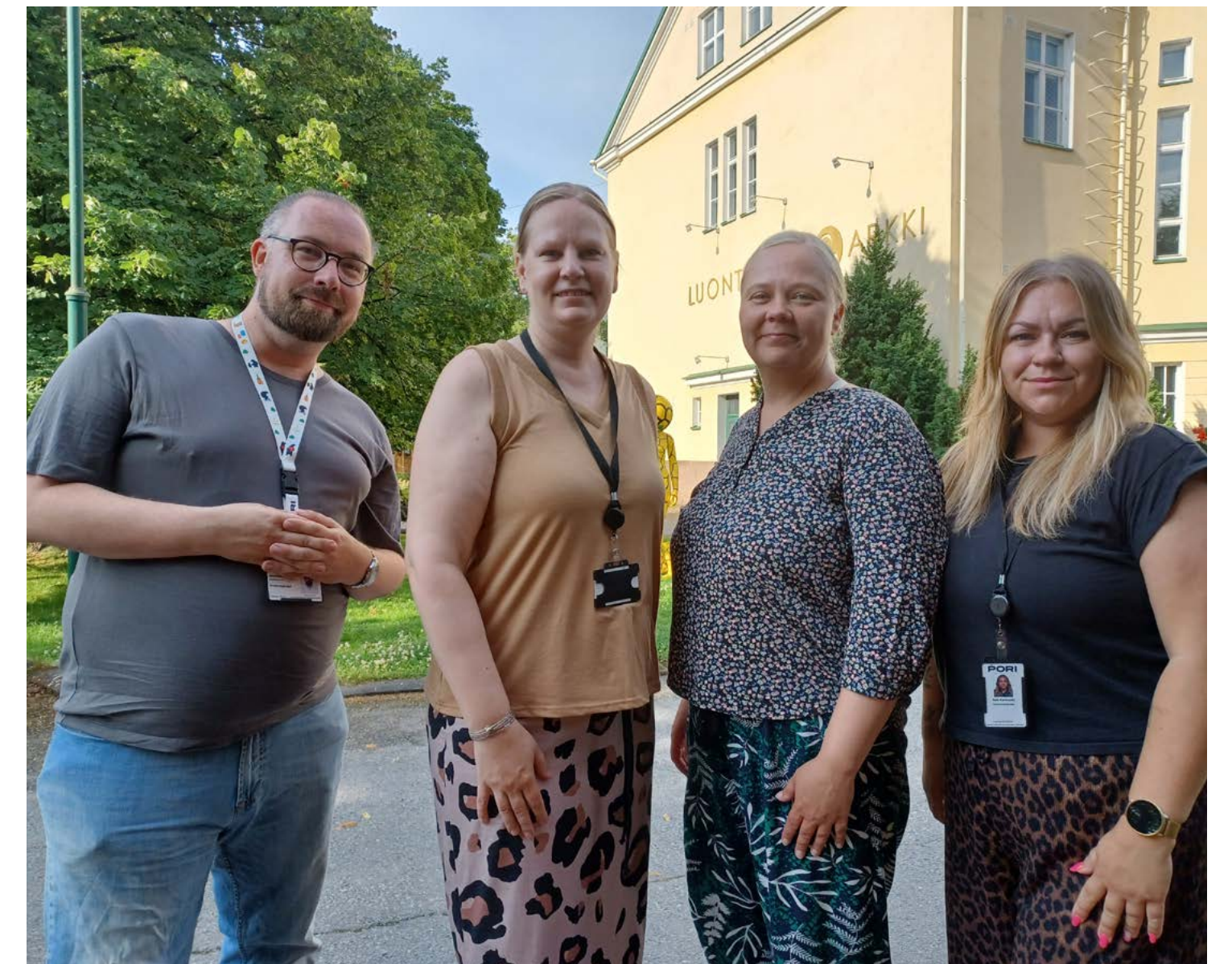
Vuonna 2025 International House Porin tiimi muutti Luontotalo Arkin yläkertaan.

Syksyllä 2025 uutena toimintamuotona käynnistyi Satakunta Business Connect -verkoston toiminta. Aloitustapahtuma kokosi yhteen maahanmuuttajataustaisia yrittäjiä ja yrittäjyydestä kiinnostuneita.