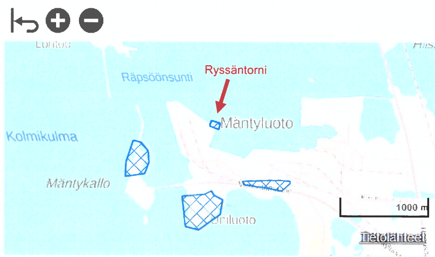
Mäntyluodon luotsi- ja majakkaympäristön RKY-rajaus. www.rky.fi