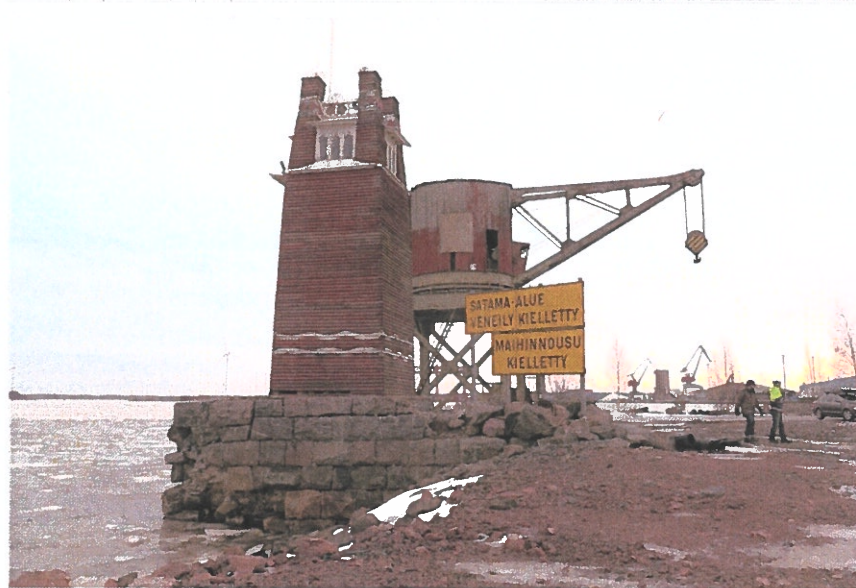
Ryssäntorni ja Luveeni sekä jäljellä olevaa kivilaituria 7.1.2019.