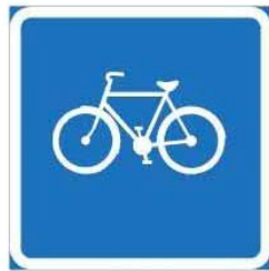
681 POLKUPYÖRILLE TARKOITETTU REITTI + NUOLI 812