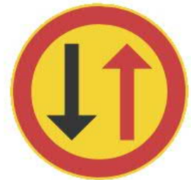
222 VÄISTÄMIS- VELVILLISUUS KOHDATAESSA