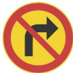
333 KÄÄNTYMINEN OIKEALLE KIELLETTY