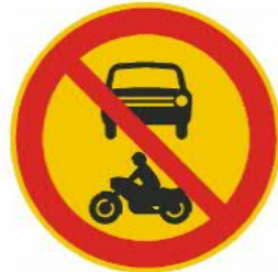
312 MOOTORIKÄYTTÖISELLÄ AJONEUVOLLA AJO KIELLETTY