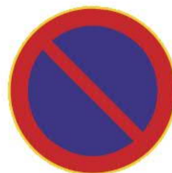
372 PYSÄKÖINTI KIELLETTY