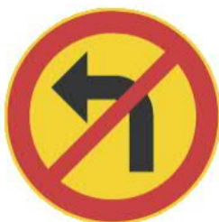
332 KÄÄNTYMINEN VASEMMALLE KIELLETTY