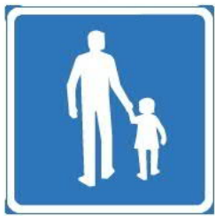
682 JALANKULKIJOILLE TARKOITETTU REITTI + NUOLI 812