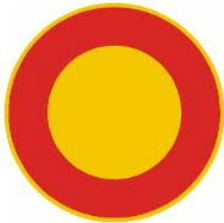
311 AJONEUVOLLA AJO KIELLETTY