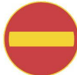
331 KIELLETTY AJOSUUNTA